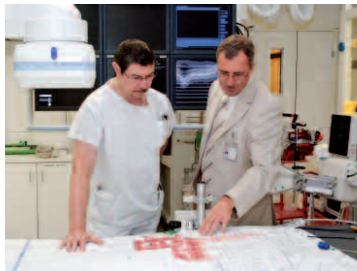
La formation va permettre de mieux comprendre, par exemple, les besoins du personnel soignant.

La HES-SO a lancé au début de l'année une formation postgraduée en bio-ingénierie. Seize inscrits pour cette première volée de Suisse.